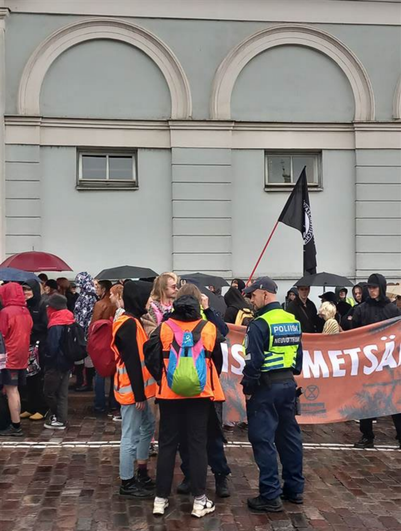
Poliisin neuvottelija keskustelee mielenosoittajien kanssa Näpit irti! -mielenosoituksessa 19.9.