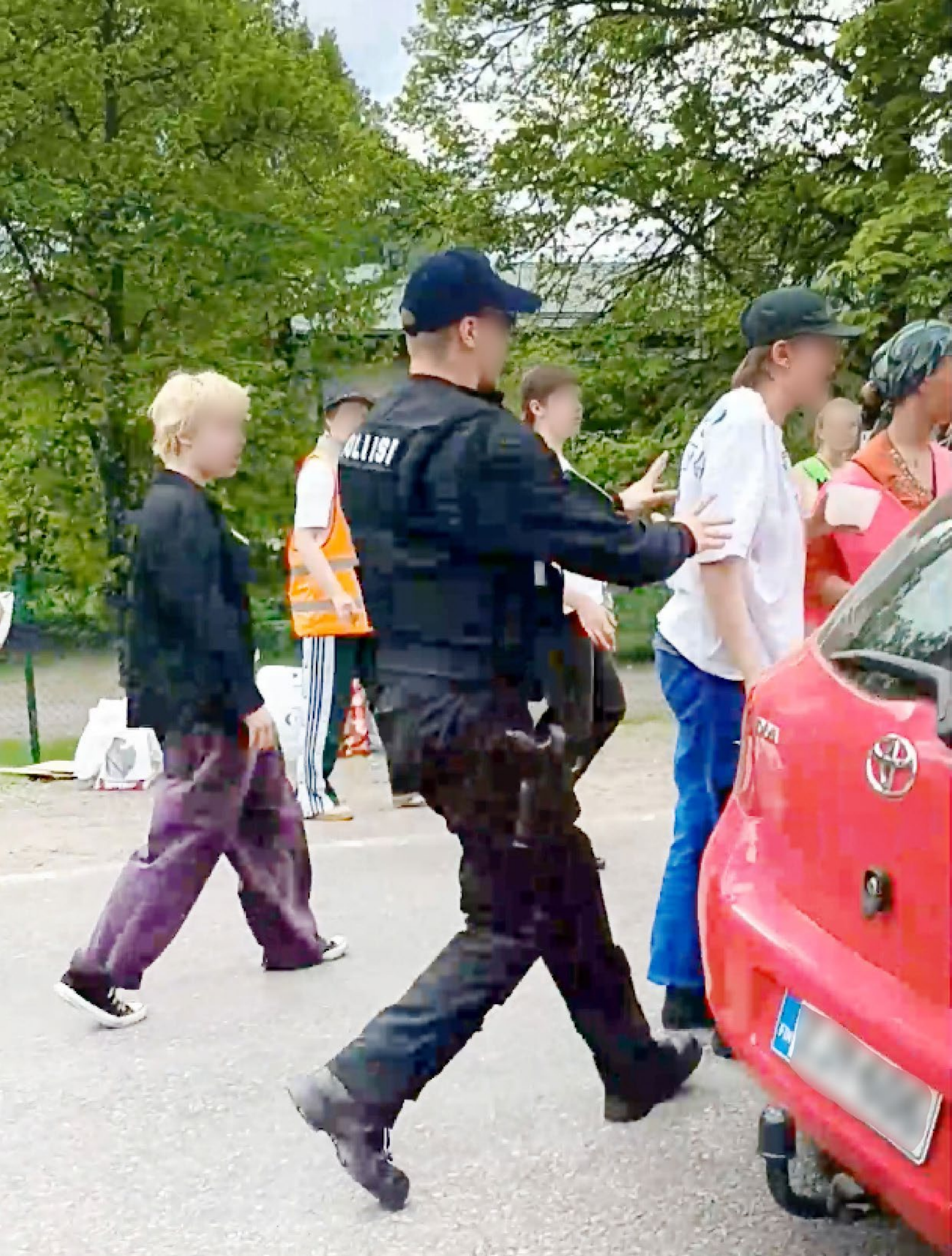
Punainen henkilöauto ajaa mielenosoittajia päin Elokapinan tiesulussa UPM:n tehtaalla Kouvolassa.