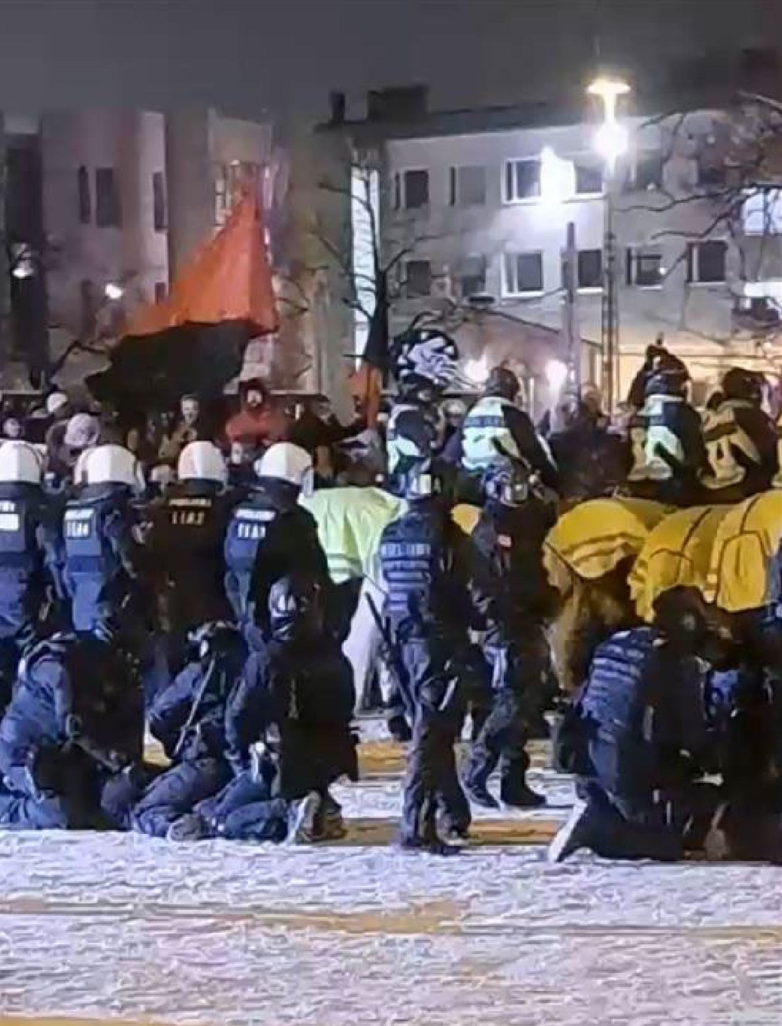
Poliisit pittelevät mielenosoittajia maassa Helsinki ilman natsseja -mielenosoituksessa 6.12.