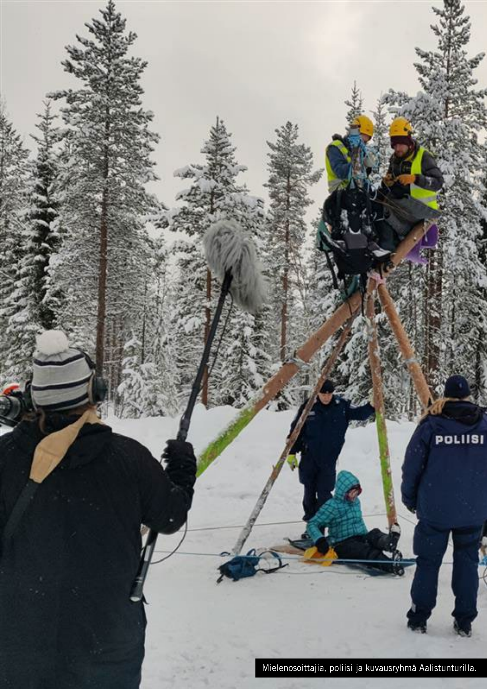
Mielenosoittajia, poliisi ja kuvausryhmä Aalistunturilla.