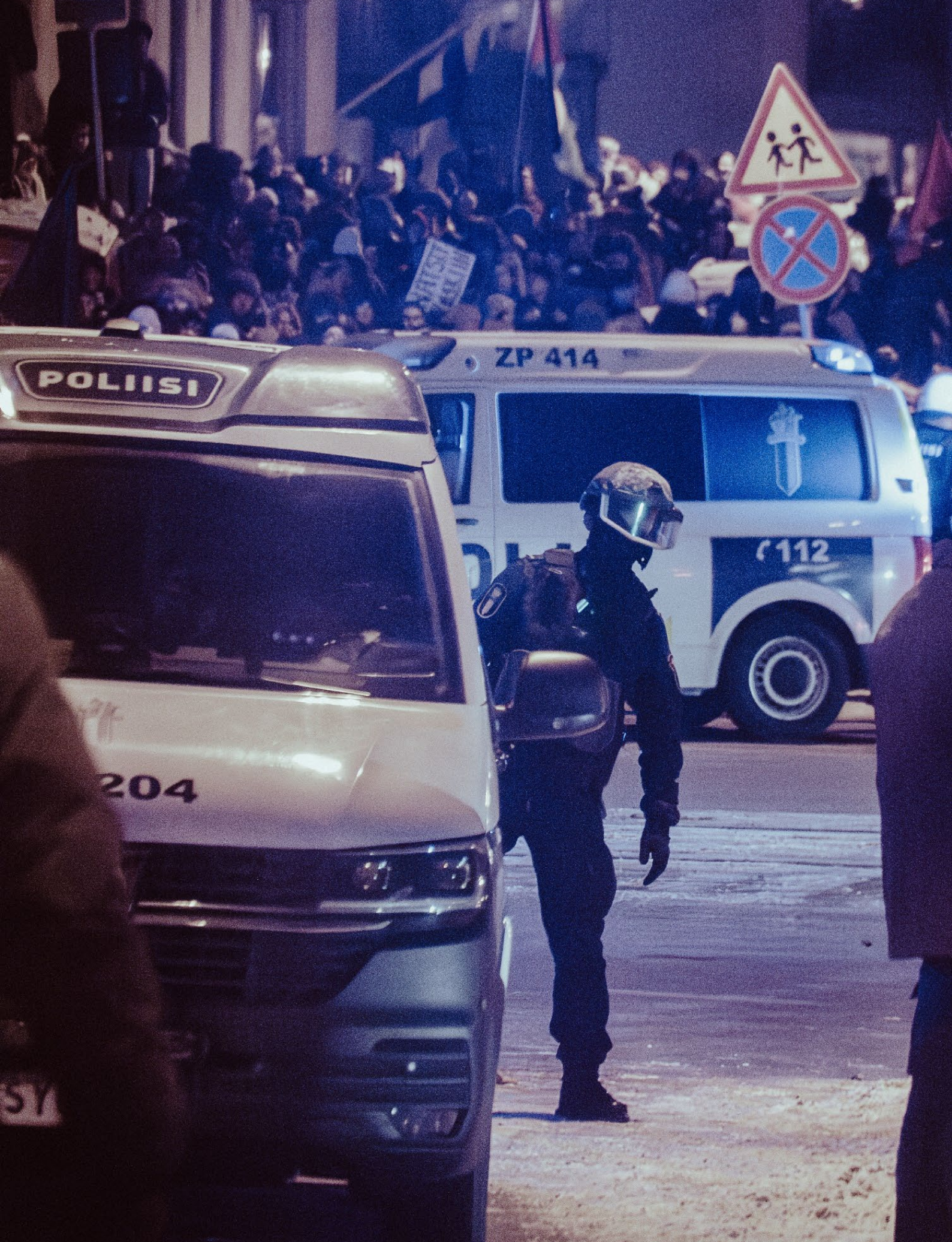
Joukkojenhallintapoliisi ja mielenosoittajia Helsinki ilman natsseja -mielenosoituksessa 6.12.