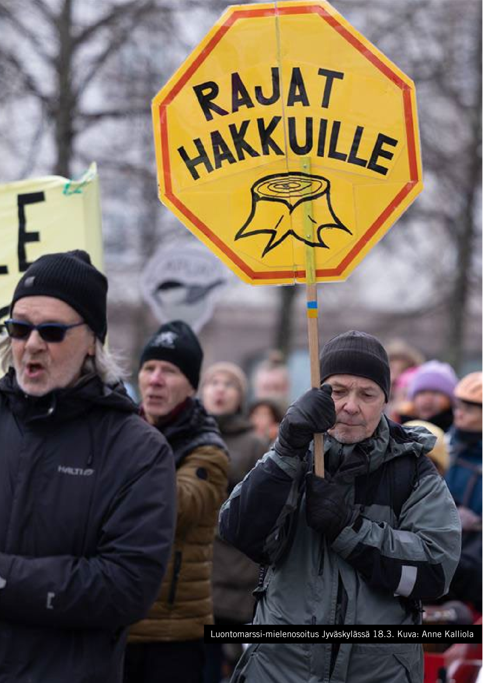
Luontomarssi-mielenosoitus Jyväskylässä 18.3.